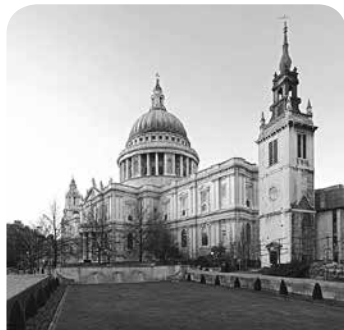
Cadeirlan St Paul yn Llundain