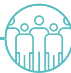
YSBRYD A CHYMUNED