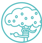
GWREIDDIAU AC YSTYR