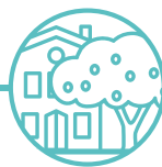
GOBAITH A CHARTREF