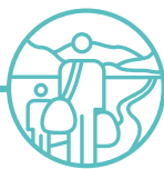
ALLTUDIAETH A HEDDWCH